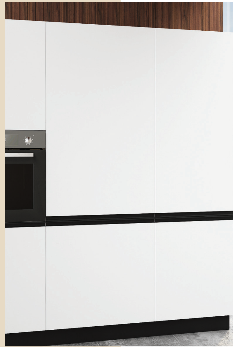
COLONNA DA 75 CM