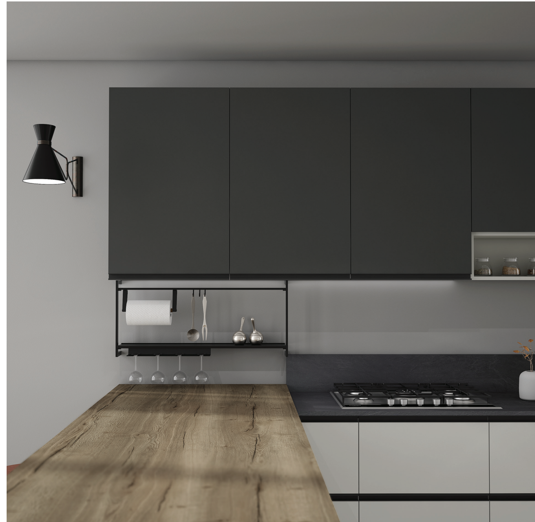
SOTTOPENSILE E MANIGLIA