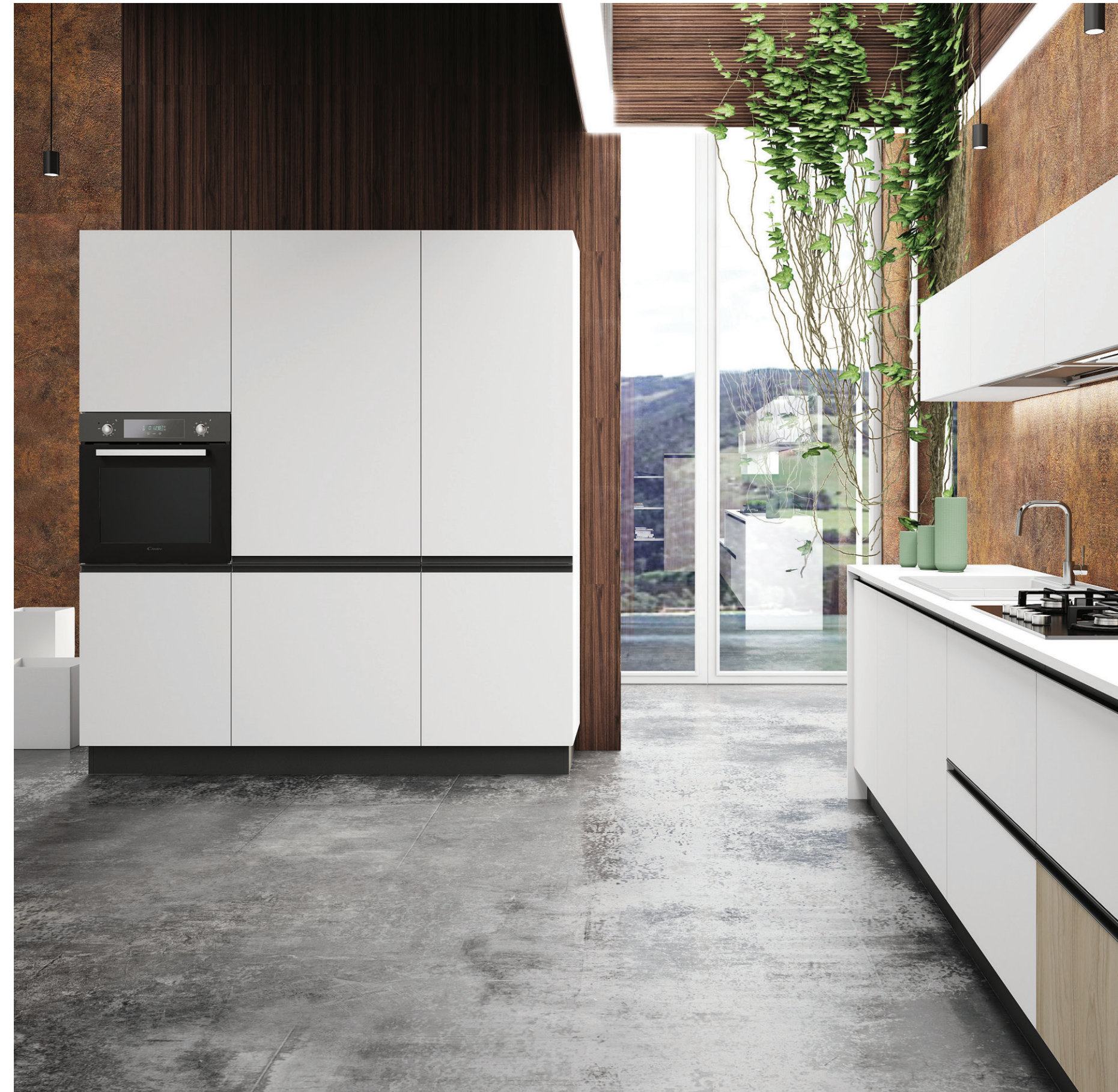
COLONNA DA 75 CM