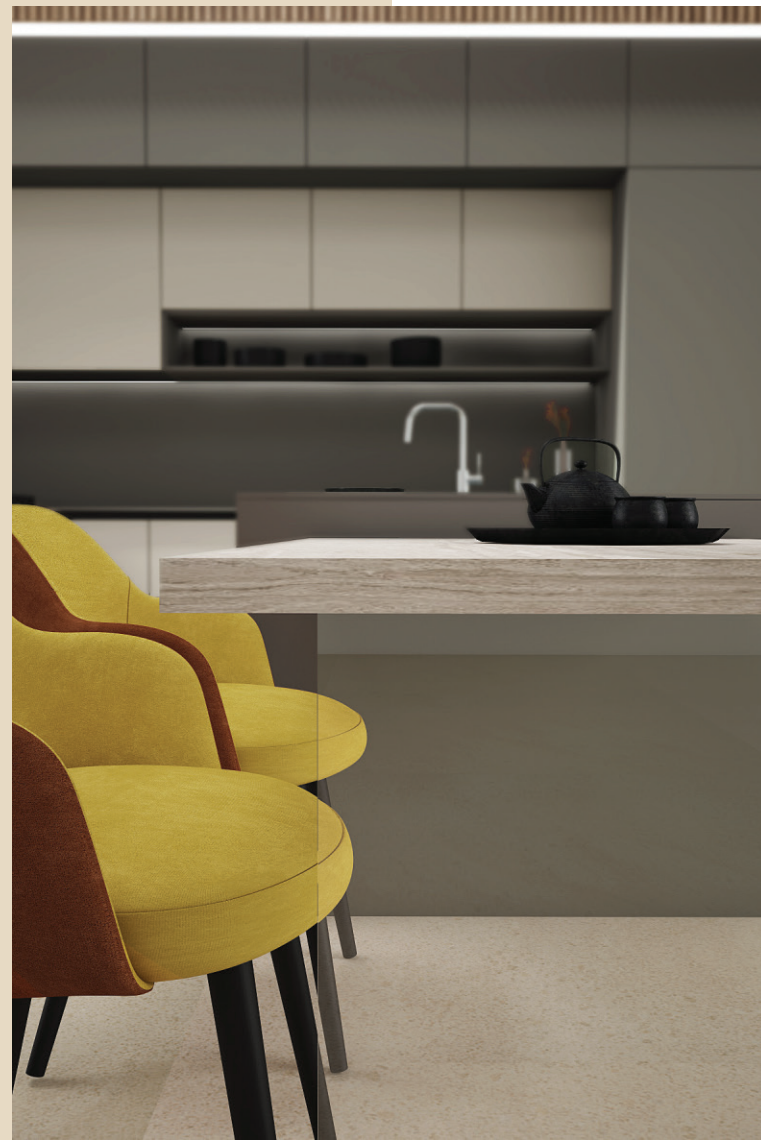
GAMBA PENISOLA IN VETRO