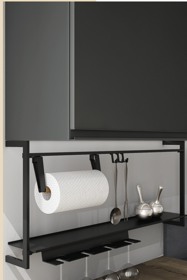
SOTTOPENSILE E MANIGLIA