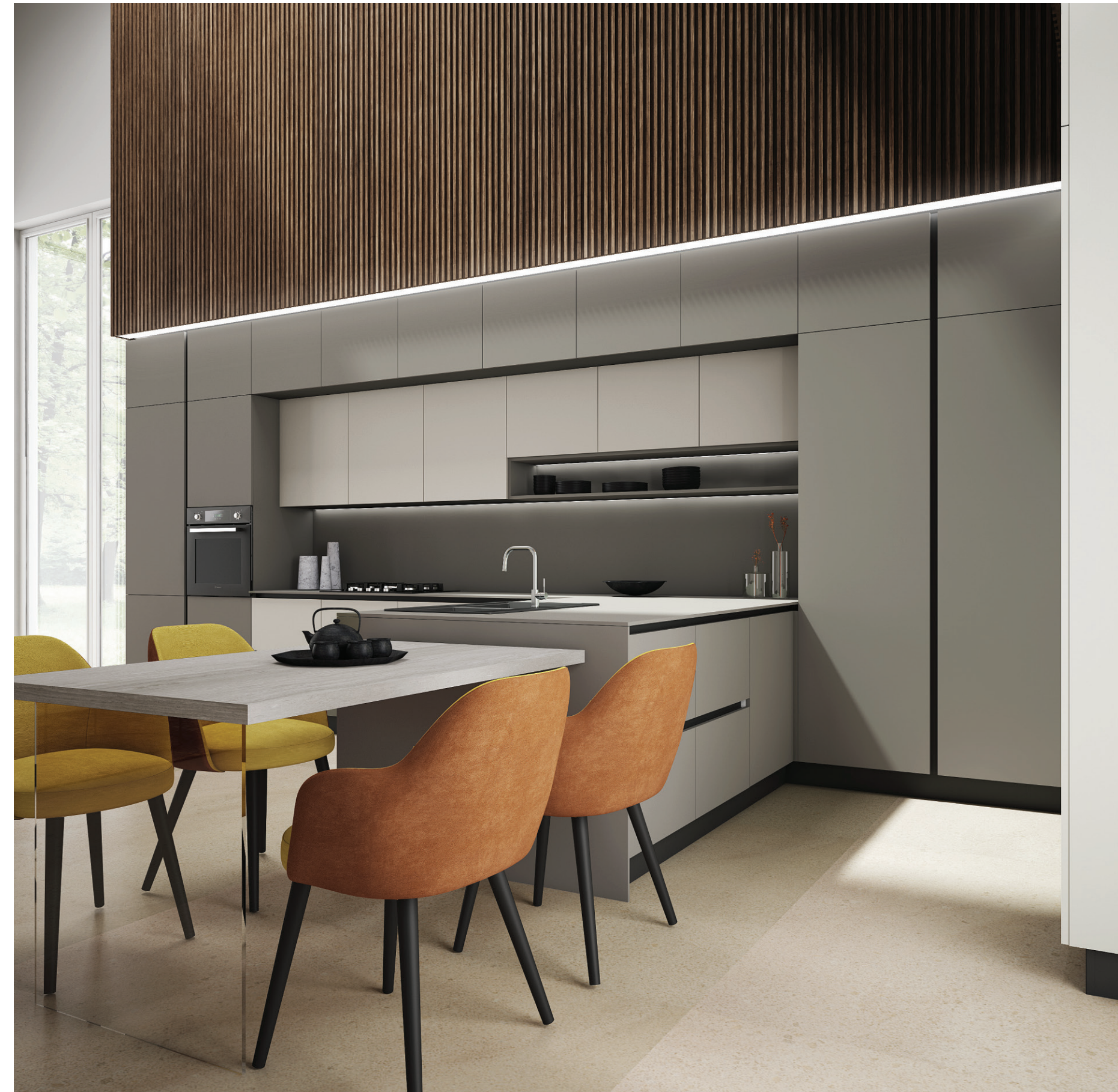
GAMBA PENISOLA IN VETRO